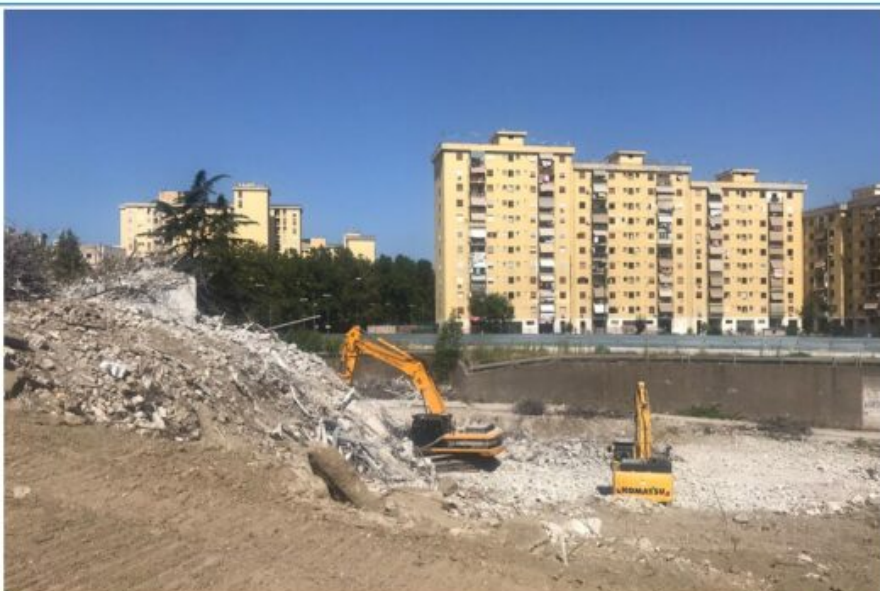
Abbattimento Vela A – Operazioni concluse