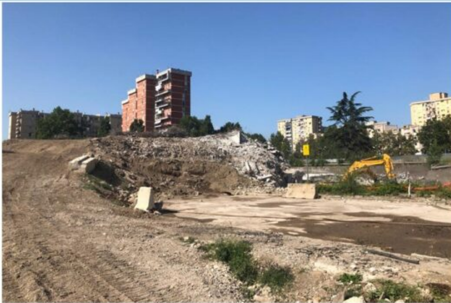
Abbattimento Vela A – Operazioni concluse