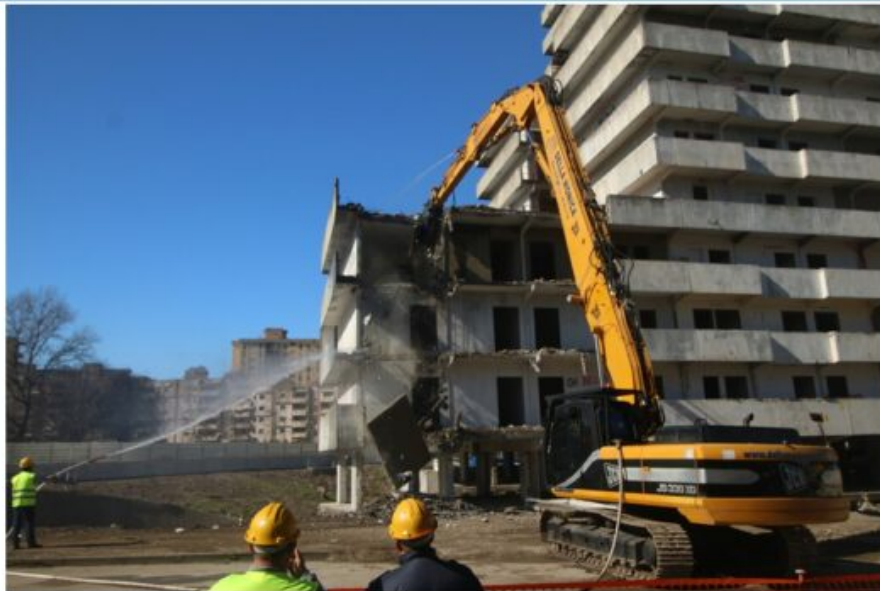
Abbattimento Vela A I primi cornicioni abbattuti