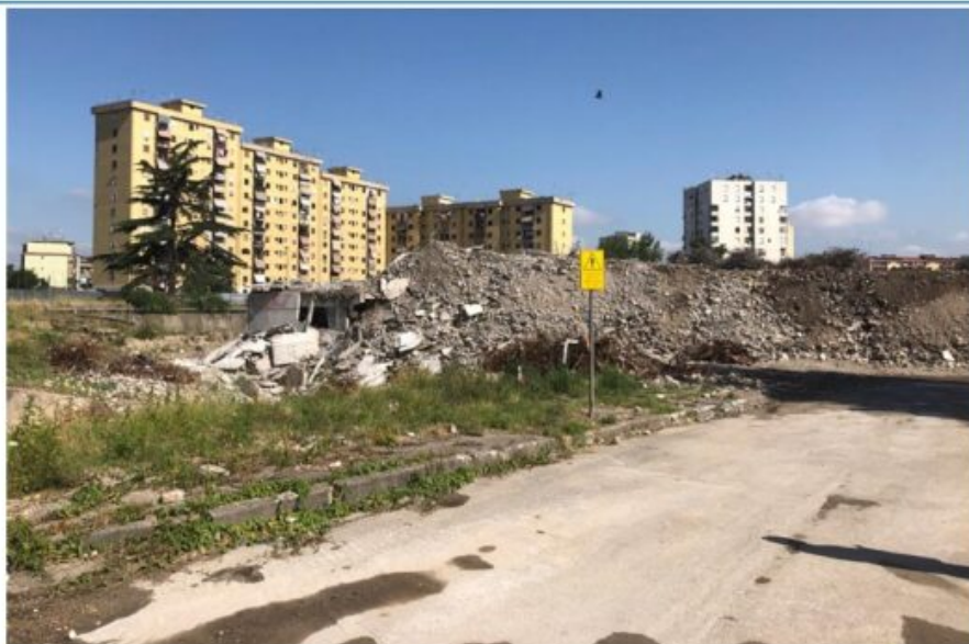
Abbattimento Vela A – Operazioni concluse