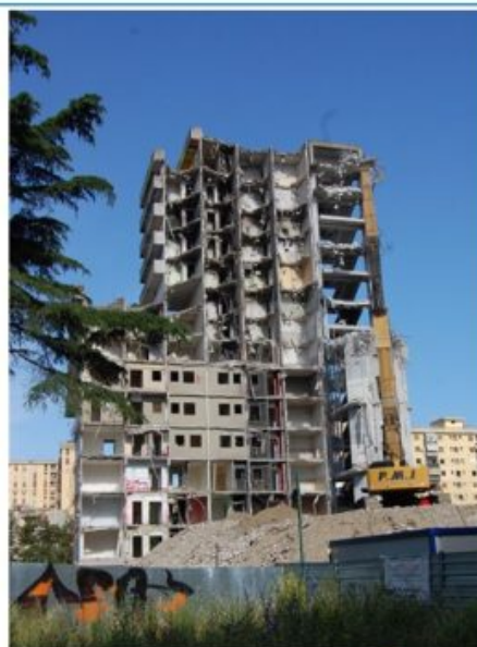
Abbattimento Vela A La «Superdemolition PMI 980» al lavoro