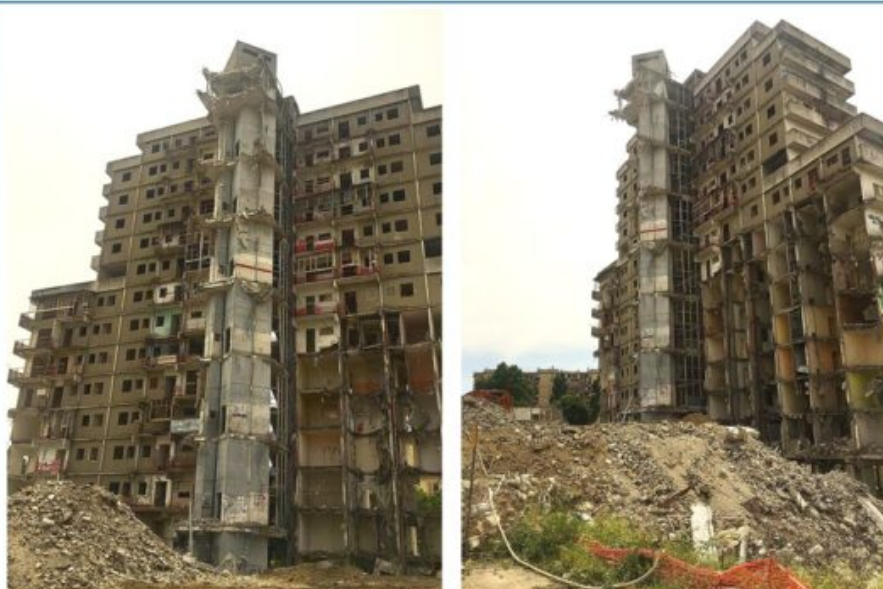
Abbattimento Vela A I lavori a metà dell'opera