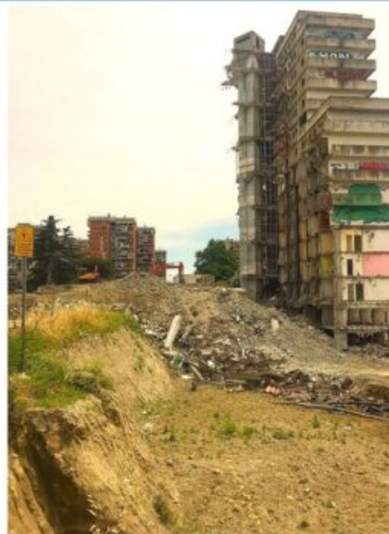
Abbattimento Vela A I lavori a metà dell'opera