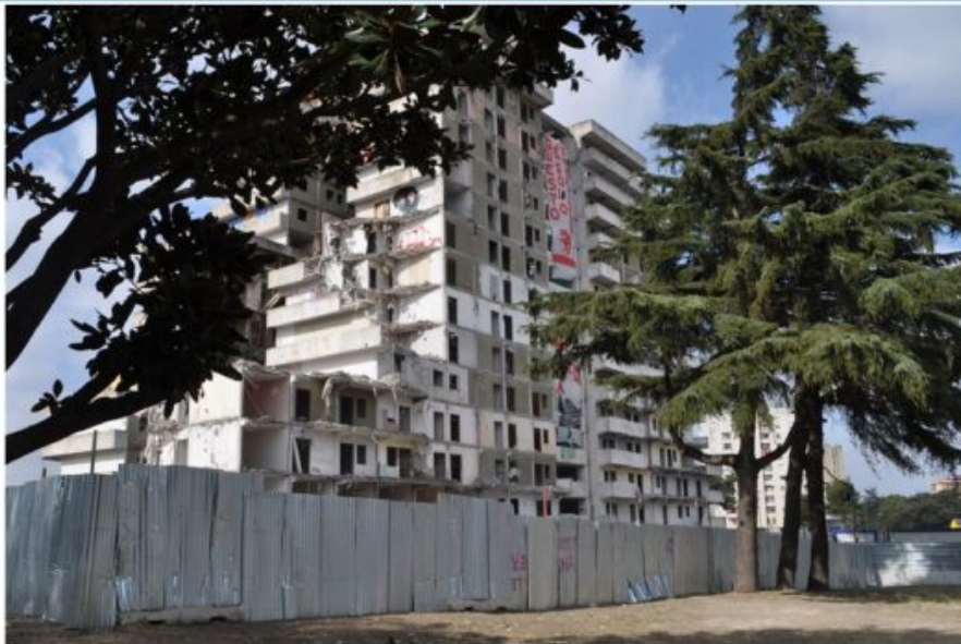
Abbattimento Vela A Le prime fasi dei lavori