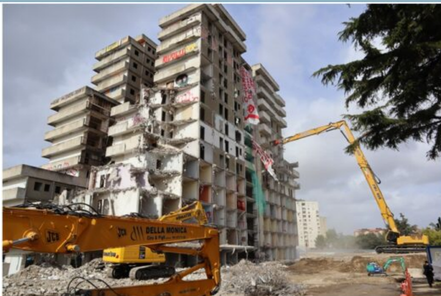
Abbattimento Vela A Le prime fasi dei lavori