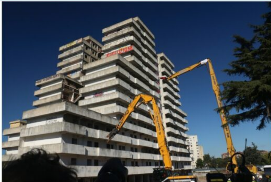
Abbattimento Vela A

20 febbraio 2020, ore 11:17: il primo morso