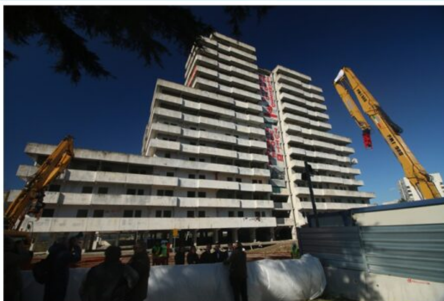
Abbattimento Vela A

Scampia. Le immagini dall'alto della Vela.