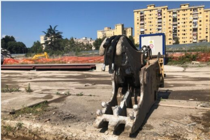
Abbattimento Vela A – Operazioni concluse