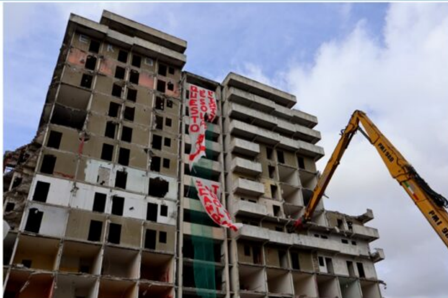
Abbattimento Vela A Le prime fasi dei lavori