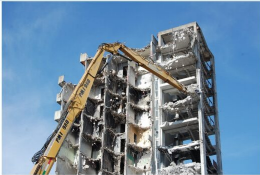
Abbattimento Vela A

La «Superdemolition PMI 980» aggredisce i residui